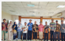
Kunjungan Kerja dan MoU Universitas Muhammadiyah Yogyakarta dengan Universitas Muhammadiyah Tangerang.