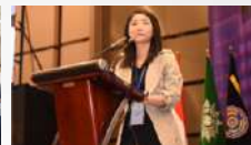
Sambutan dari IOA Officer of Yuanpei University of Medical Technology Taiwan