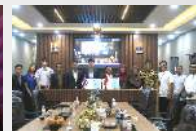
MoU Kerja sama dengan Kerajaan Thailand.