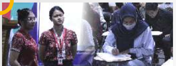
Kerjasama dengan PT. Mayora Indah, TBK mengadakan Campus Hiring untuk lulusan terbaik UMT.